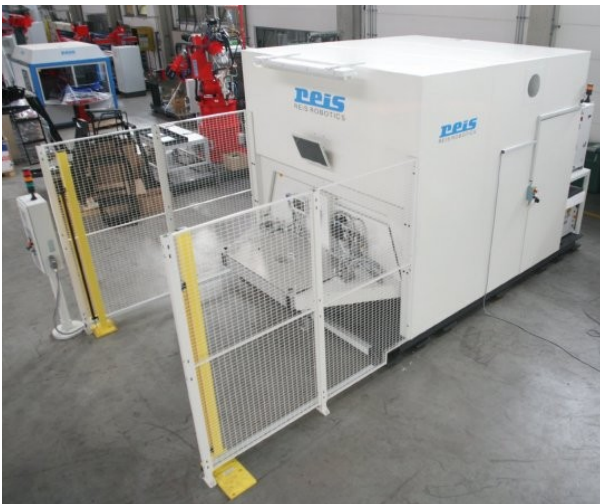
Afbeelding 1: Plug & Weld Lasercompactlascel